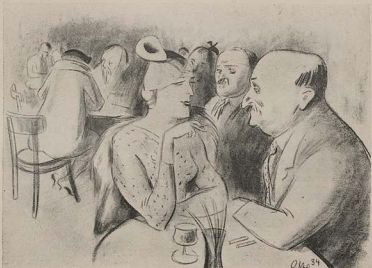
„Sehen Sie, Fräulein, der Umstand, daß fast alle Frauen rauchen, hat mir das Heiraten erleichtert.“ „Ja, man ahnt gar nicht, was man der Zigarettenindustrie alles zu verdanken hat.“

mils in Kauf zu nehmen, die sich aber ohne weiteres in einem gut ausgleichenden Entwickler wie Emaflo, Mikro u. a. unwirksam machen läßt, so daß wir den Himmel in seinen feinsten Abtönungen erhalten, wie wir ihn empfinden.